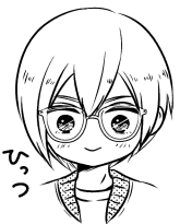
レンズ大きめでフレームがクリアなやつ可愛い。

オシャレな眼鏡が谷欠!!! と思いつ、なかなか買えずにいます...。こはあけで、うちの子にかけてもらおうの巻。