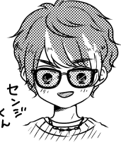
誕生日絵にも描いた黒字に青いこいのグラサン。117ブランド? 本気はなんでも良そう。