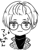
ミルバーフレームのTHE:丸めがね。うさくさいイケメンにかけたいわ。